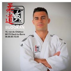
Le Directeur Technique